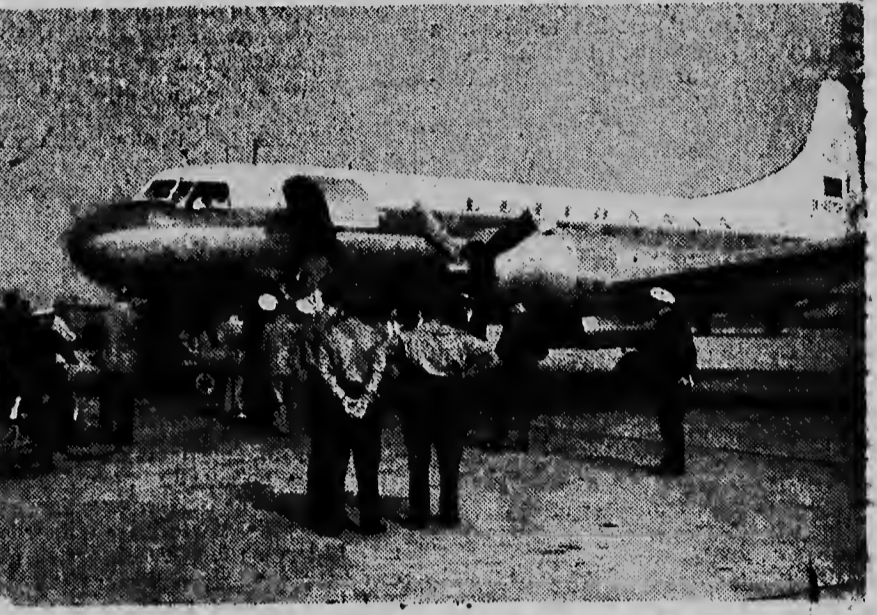
Voor de eerste maal sinds de oorlog is een Duits verkeersvliegtuig geland op de Amsterdamse luchthaven Schiphol. Het toestel — een Convalr — was onderweg naar Düsseldorf, doch moest door de weersomstandigheden daar uitwijken. Direct na de landing begon men met bijtanken — de machine moest echter een aantal uren op Schiphol blijven.